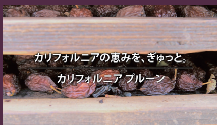
カリフォルニアの恵みを、ぎゅっと。