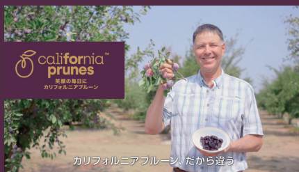
カリフォルニアプルーン、だから選ぼう