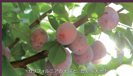
カリフォルニアの太陽と、豊かな大地が