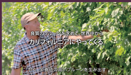
良質のプルーンを求めて、世界中から カリフォルニアにやってくる。