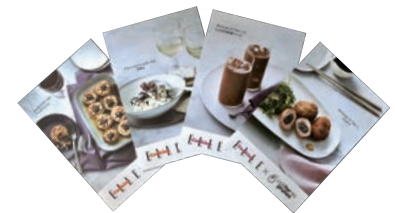
スイングPOP 4種類セット