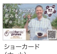
ショーカード (大、小)